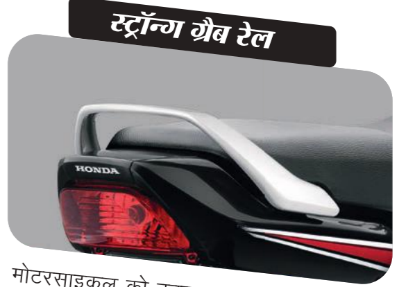
स्ट्रॉन्ग ग्रैब रेल