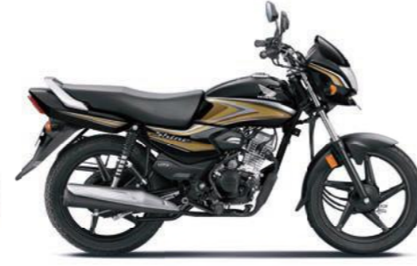
गोल्ड के साथ ब्लैक