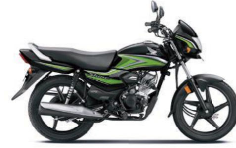
ग्रीन के साथ ब्लैक