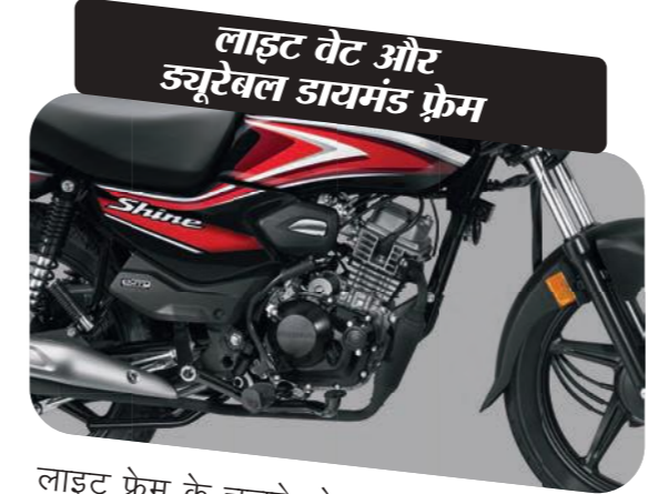
लाइट वेट और ड्युरेबल डायमंड फ्रेम

जब साइड स्टैंड इंजेज हो और व्हीकल को गियर पर डाला जाए तो राइडर की सुरक्षा के लिए ये इग्निशन को कट ऑफ कर देता है।