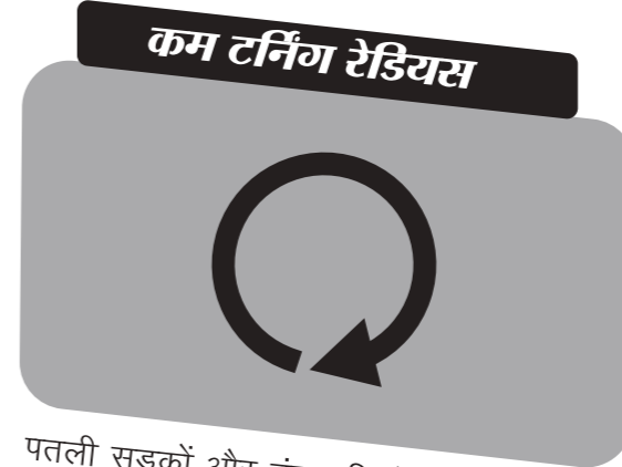
कम टर्निंग रेडियस

लाइट फ्रेम के चलते मोटरसाइकल का वज़न बहुत ज़्यादा नहीं होता जिससे इसे संभालना आसान होता है। इसका ड्युरेबल / टिकाऊ और मजबूत फ्रेम हर तरह की सड़क के लिए कामयाब है और भार लादने की भी सुविधा देता है।